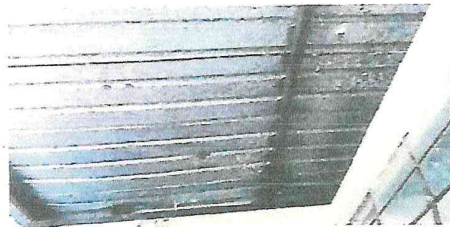
techado en mal estado