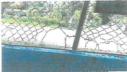
Circulación Perimetral en mal estado