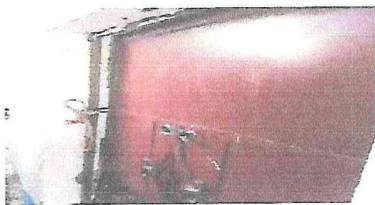
puerta en la cocina en mal estado