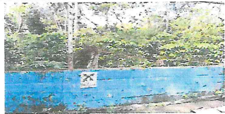
muro perimetral en mal estado